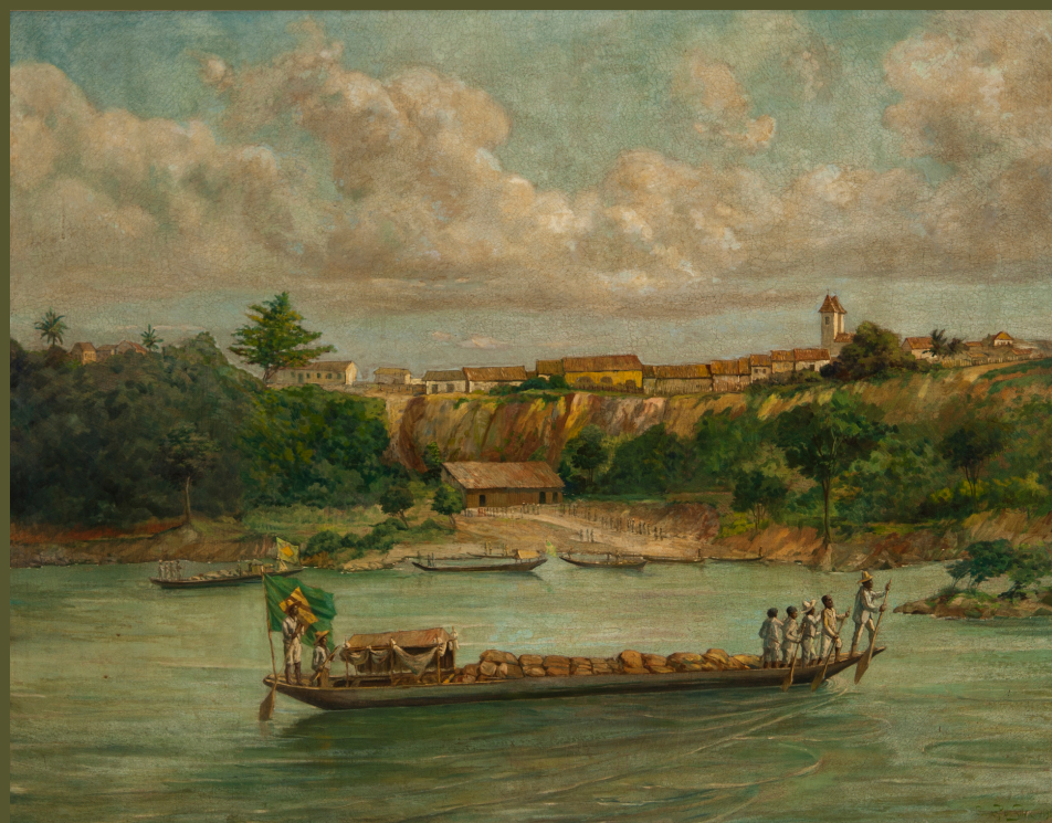
Partida de Porto Feliz, óleo sobre tela – 130 x 86cm, Oscar Pereira da Silva (1867 – 1939). Baseado na aquarela de Adrien Aimé Taunay (1803 – 1828). Acervo do Museu Paulista da USP.