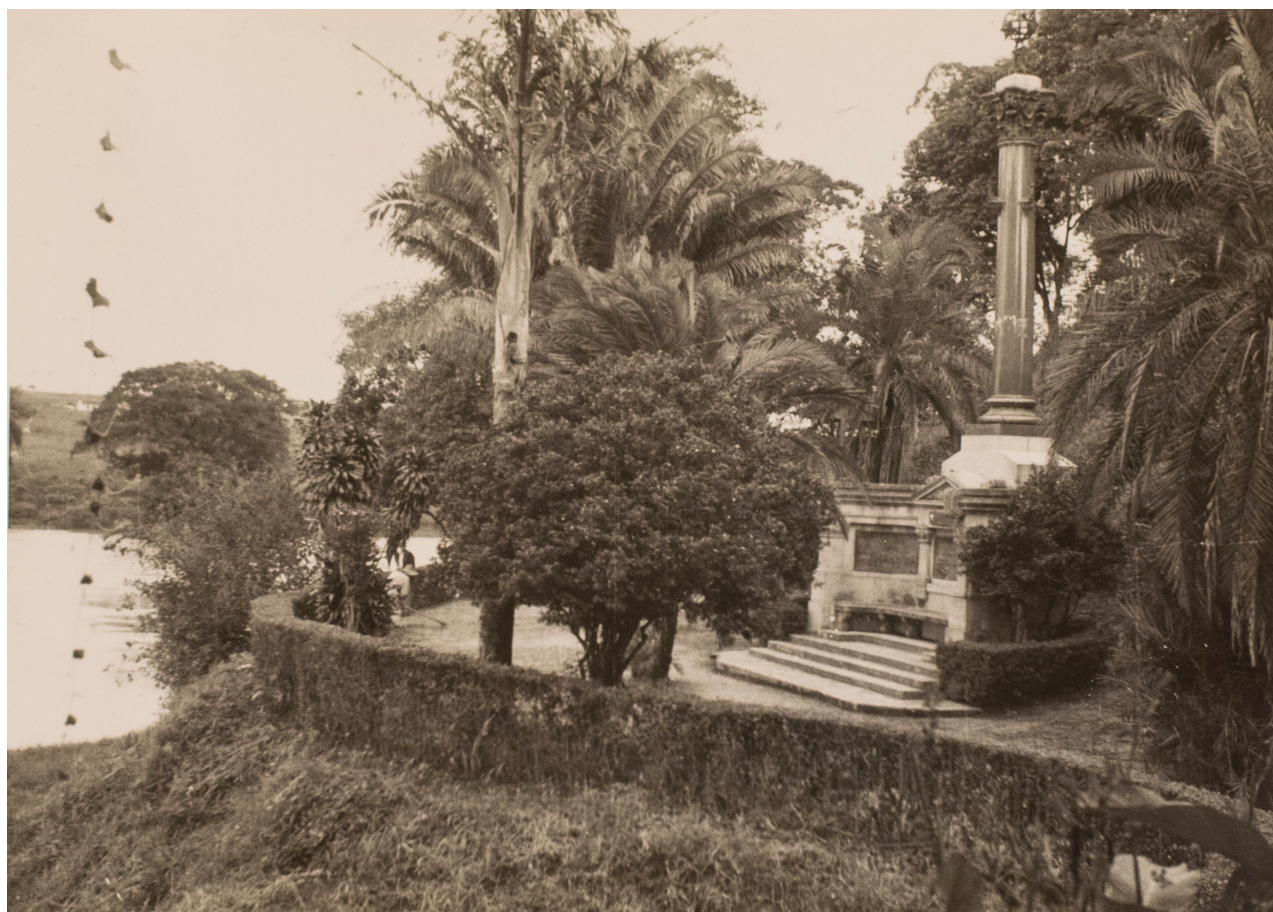
Monumento às Monções - década de 1950

Como representação máxima, perpetuada pelo Monumento aos Bandeirantes, a poucos metros das águas do Tietê, há um conjunto escultural que rememora o movimento das monções do século XVIII, produzido pelo escultor italiano Amedeo Zani e encomendado por Cândido Mota, na época Secretário de Estado dos Negócios da Agricultura. Sua inauguração ocorreu em 26 de abril de 1920, com a presença de Altino Arantes, governador do Estado de São Paulo e de um grupo de jornalistas e historiadores. Afonso de Escagnolle Taunay, que além de historiador era o então diretor do Museu Paulista – popularmente chamado de Museu do Ipiranga, fez o discurso oficial da solenidade. Ele dedicou a sua fala à Glória das Monções.