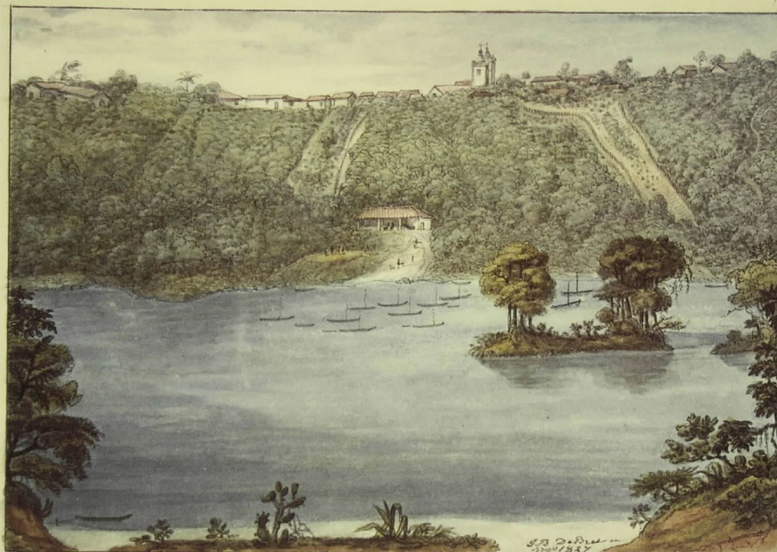
Porto Feliz, vista da margem ocidental do Tietê (1827), aquarela. Jean-Baptiste Debret. Coleção Condes de Bonneval.