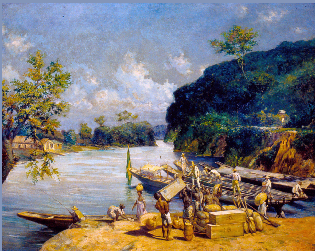
Carga de canoas, óleo sobre tela – 140 x 110 cm, Oscar Pereira da Silva (1867 – 1939). Baseado no desenho original de Hercules Florence (1804 -1879). Acervo do Museu Paulista da USP.